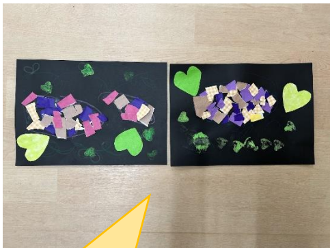
さつまいものちぎり絵