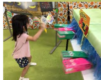
おまつり たのしかったね◎