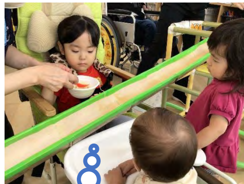
そうめんとれるかな！？ (みんな真剣です(^^)♪